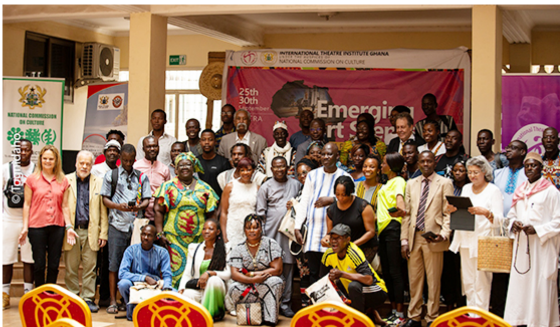
Photo de l'ouverture des Scènes émergentes en Afrique, au Ghana